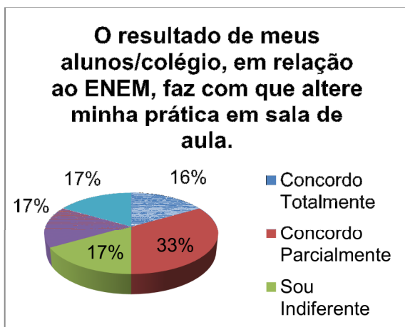
Gráfico 1 – Colégio público

Em relação alteração das práticas docentes em função do ENEM em colégios público e privado obtivemos os seguintes resultados: