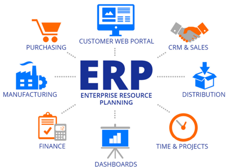
Figura 01: ERP

Como esses módulos trocam informações entre si é bem complexo, todos os módulos estão interligados de modo que a empresa toda esteja conectada. Na figura 01 é apresentado um diagrama de um ERP.